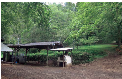
土砂に埋まったキャンプ場の整地