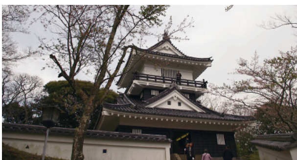
久留里城再建天守閣 久留里城は南総里見氏全盛期の居城