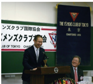
八木会長、少し緊張気味の挨拶 迫川東京クラブ会長（右） 東京クラブのバナーに歴史を感じます