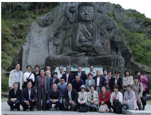
日本最大（31.05m）の薬師瑠璃光如来前にて