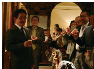
山口次期会長、乾杯の発声！