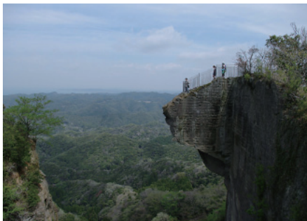
【地獄のぞき】そこから下を見ると……岩にびびってます