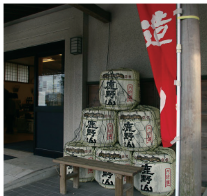
【和蔵酒造】酒造を見学 美味しいお酒も試飲しました