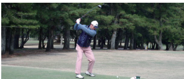
NICE SHOT!?! 中山カントリークラブにて