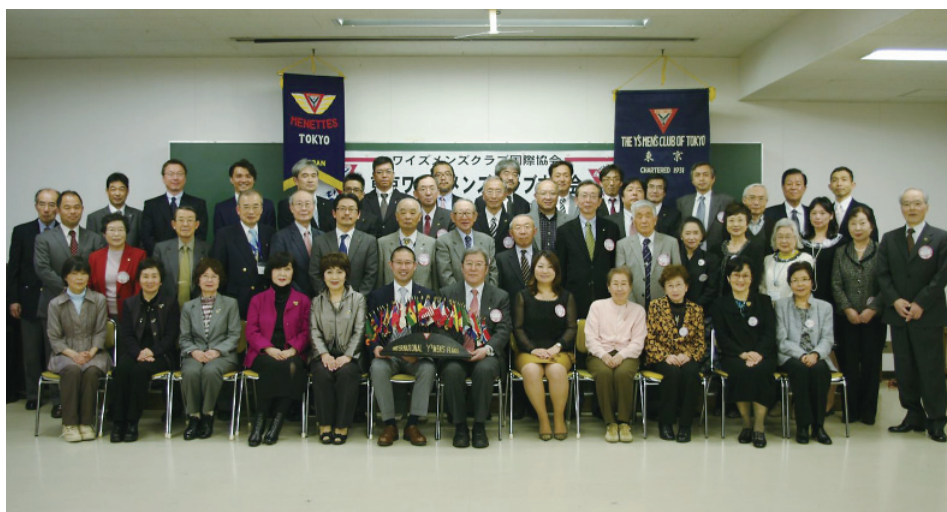
例会終了後全員で記念撮影