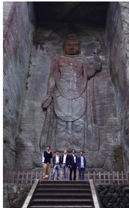
【百尺観音】世界戦争戦没病没殉難者供養、東京湾周辺の航海、航空、陸上交通犠牲者供養のため建立、また航海、航空、陸上交通の安全を守る本尊として崇められています