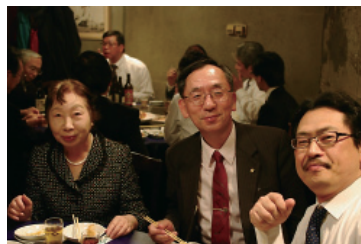
例会での緊張も少し和らいできました 美味しい食事とお酒も、みんなを笑顔にしてくれました