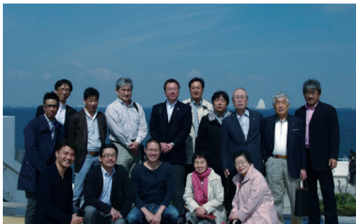
清々しい、最高の天気でした