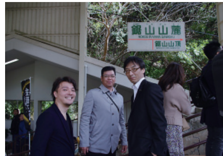
鋸山ロープウェー乗り場にて