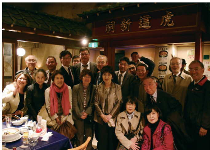
親睦夕食会終了後です。みなさんいい笑顔でした この後の二次会でも大盛り上がり