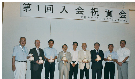
菅原会長(中)と香山EMC委員長(右)で勢揃い