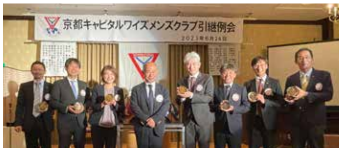
パープル賞受賞者