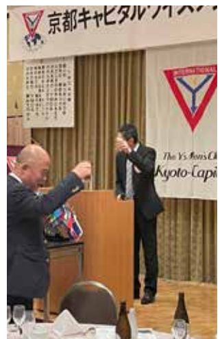
次々期会長 乾杯の挨拶