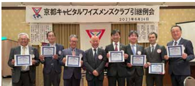
オール例会出席表彰