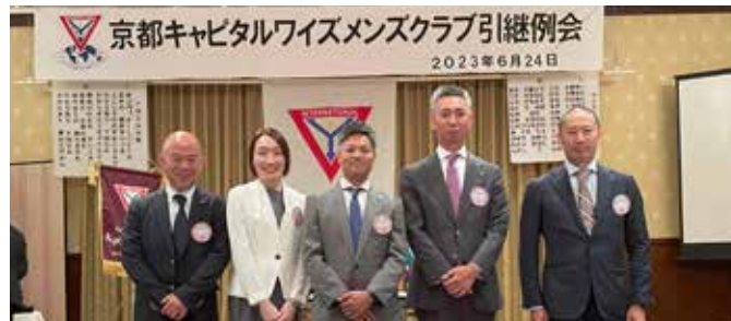
新入会員の皆さん