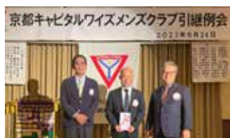
次期会長への引継