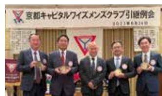
第40期三役会の皆さん