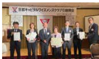
日本区アワード表彰