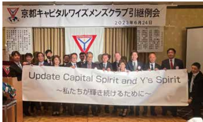
第41期椿森会長と役員の皆さん