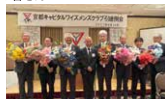
京都部役員の皆さん