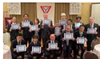
メイクアップ例会出席表彰