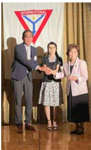
メネット会長引継